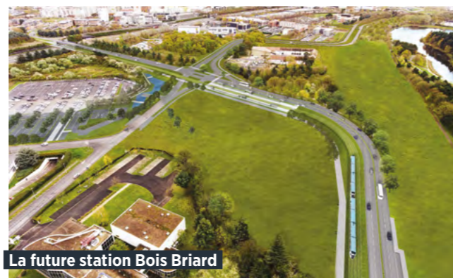
La future station Bois Briard