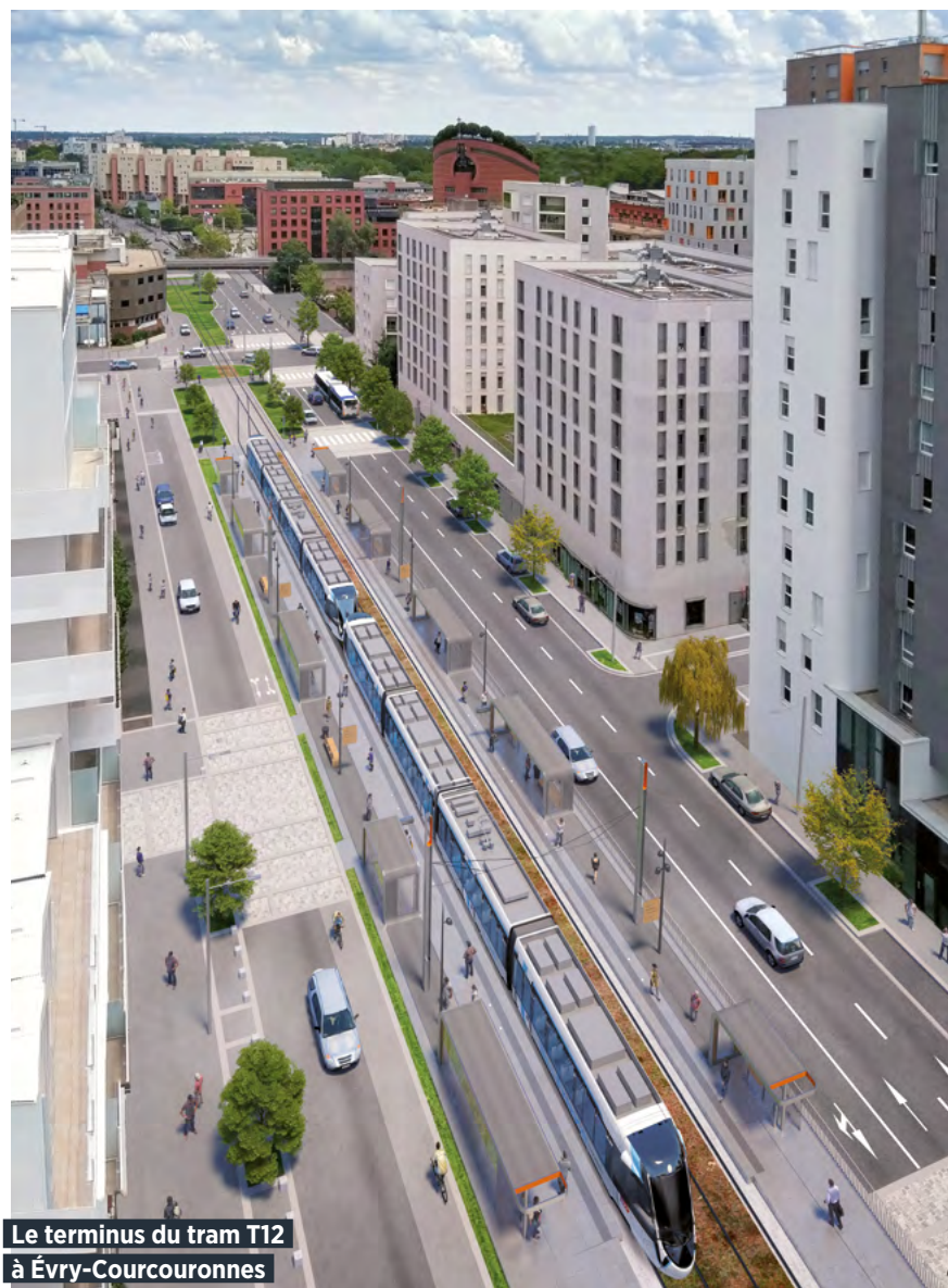
Le terminus du tram T12 à Évry-Courcouronnes