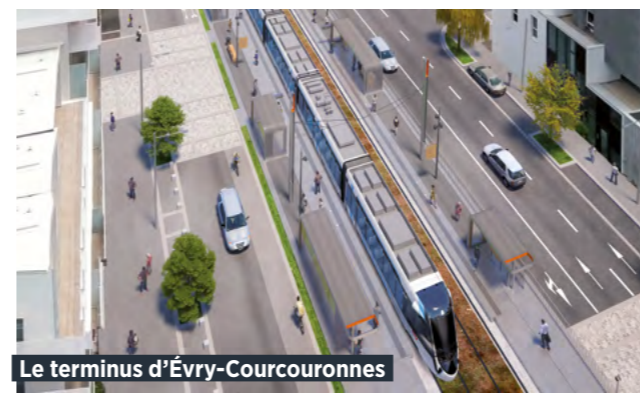
Le terminus d'Évry-Courcouronnes