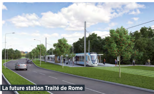
La future station Traité de Rome